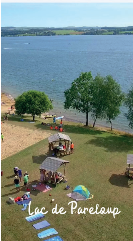
Lac de Pareloup